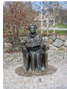
Памятник Астрид Линдгрэн в Стокгольме

:Разбойники вынуждены помириться, чтобы заставить детей вернуться домой. Шайки Борки и Маттиса объединились. Рони и Бирк поклялись, что не станут продолжателями семейного «дела», что сильно огорчило их отцов.